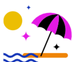
30 + 2 Tage Urlaub