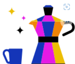
Kantine & Café- Bar