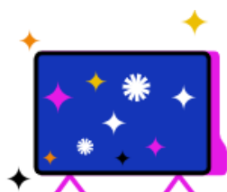
Kostenfreier Zugang zu RTL+